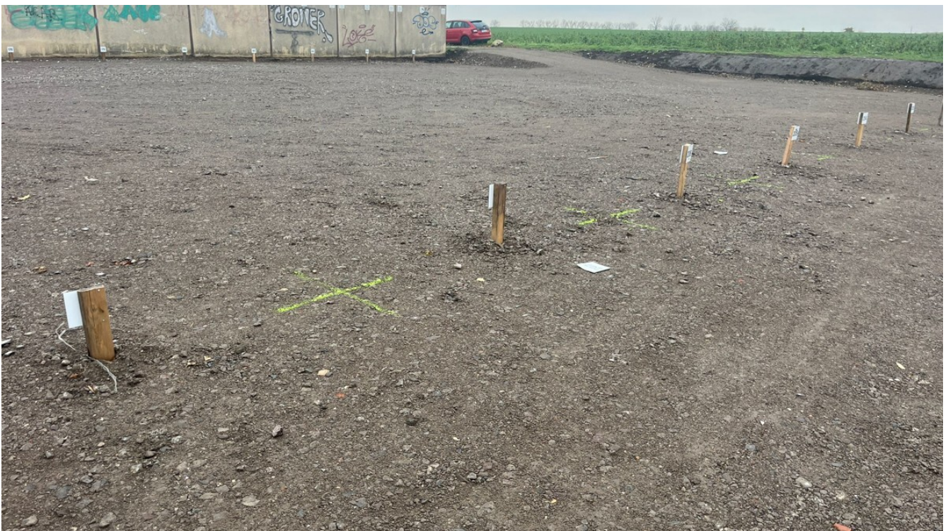
WhatsApp Image 2024-11-22 at 11.06.50