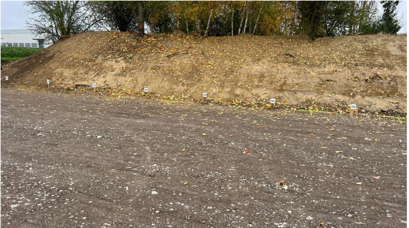
WhatsApp Image 2024-11-11 at 12.32.33 (2)

Future Construct Wir erschaffen was zählt