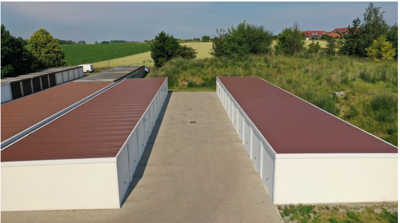
Garagenhof Groß Santerleben