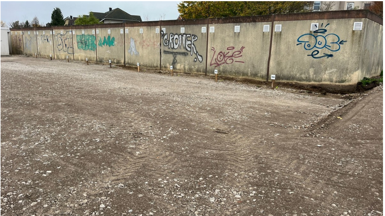
WhatsApp Image 2024-11-11 at 12.32.33 (4)

Future Construct Wir erschaffen was zählt