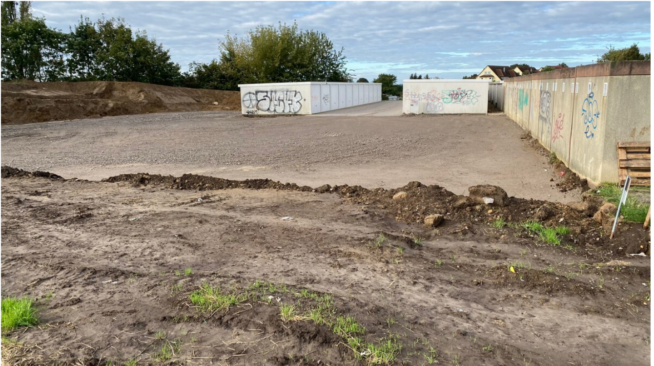
Groß Santerleben Stellplätze

Future Construct Wir erschaffen was zählt