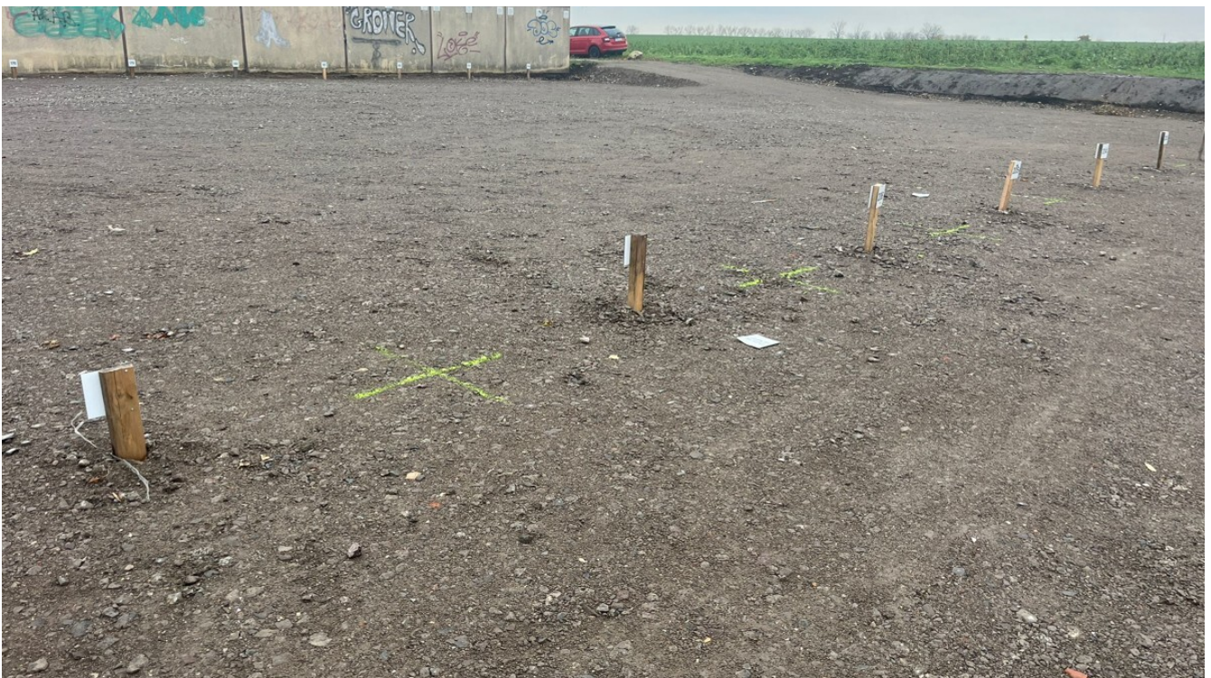
Groß SanTERSleben Stellplätze