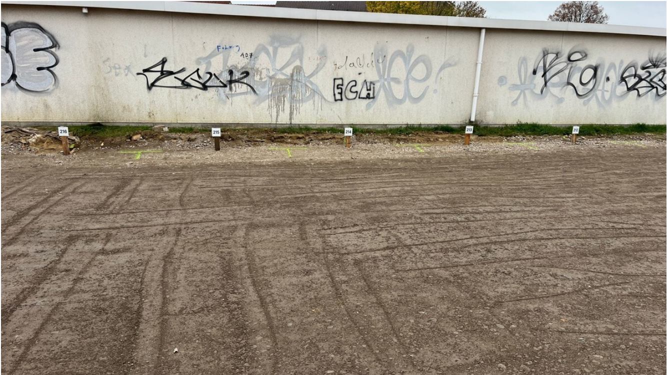
Außenstellplätze Groß SanTERSleben

Future Construct Wir erschaffen was zählt